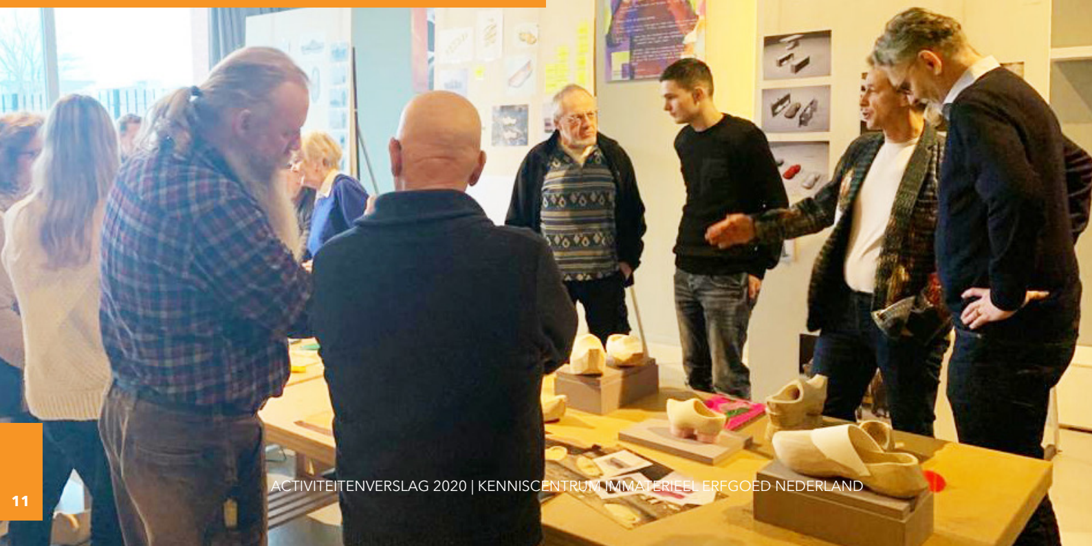
AmbachtenLab Klompenmaken in de Museumfabriek in Enschede

“In een AmbachtenLab worden de verschillende schakels uit een productieproces bijeengebracht voor kennisoverdracht, inspiratie en innovatie.”