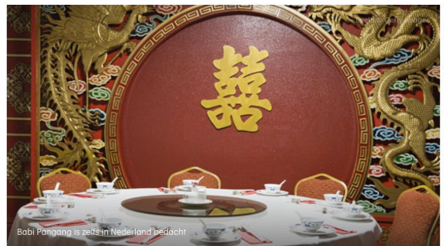
Babi Pangang is zelfs in Nederland bedacht

02 juli 2020 08:51 Aangepast: 12 februari 2021 13:27