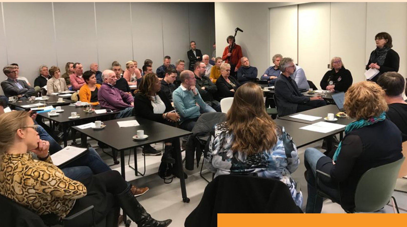
Overleg van corsocultuur in 2020

aanvulling kunnen zijn op het programma Gedeeld Cultureel Erfgoed. Op basis van de bevindingen van het onderzoek heeft het Kenniscentrum vóór 1 december 2020 bij het ministerie van OCW een plan ingediend. Dit plan heeft betrekking op de gehele beleidsperiode 2021-2024 en is gebaseerd op een projectsubsidie van vier jaar (€ 80.000 per jaar) conform het gestelde beleidskader. Het programma Gedeeld Cultureel Erfgoed (GCE) heet met ingang van 2021 Programma Internationale Erfgoedsamenwerking (PIE) .