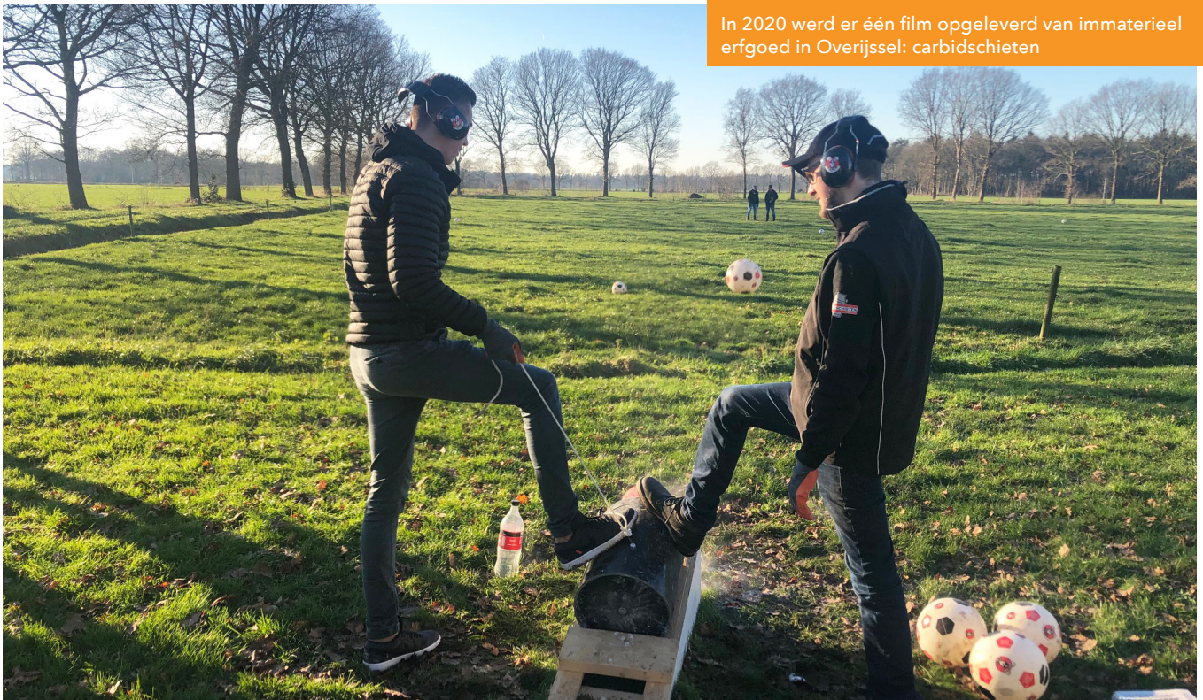
In 2020 werd er één film opgeleverd van immaterieel erfgoed in Overijssel: carbidschieten

“De samenwerking tussen de Provincie Overijssel en het Kenniscentrum zal de komende vier jaar worden voortgezet.”